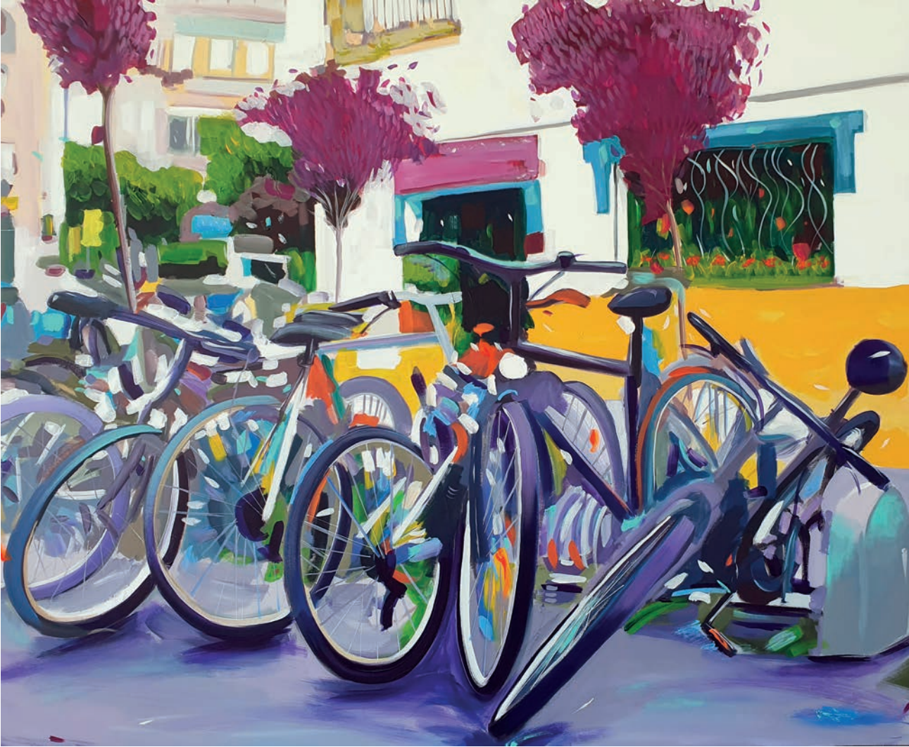
"Bisikletler" 92x110 cm, Tuval Üzerine Akrilik, 2023