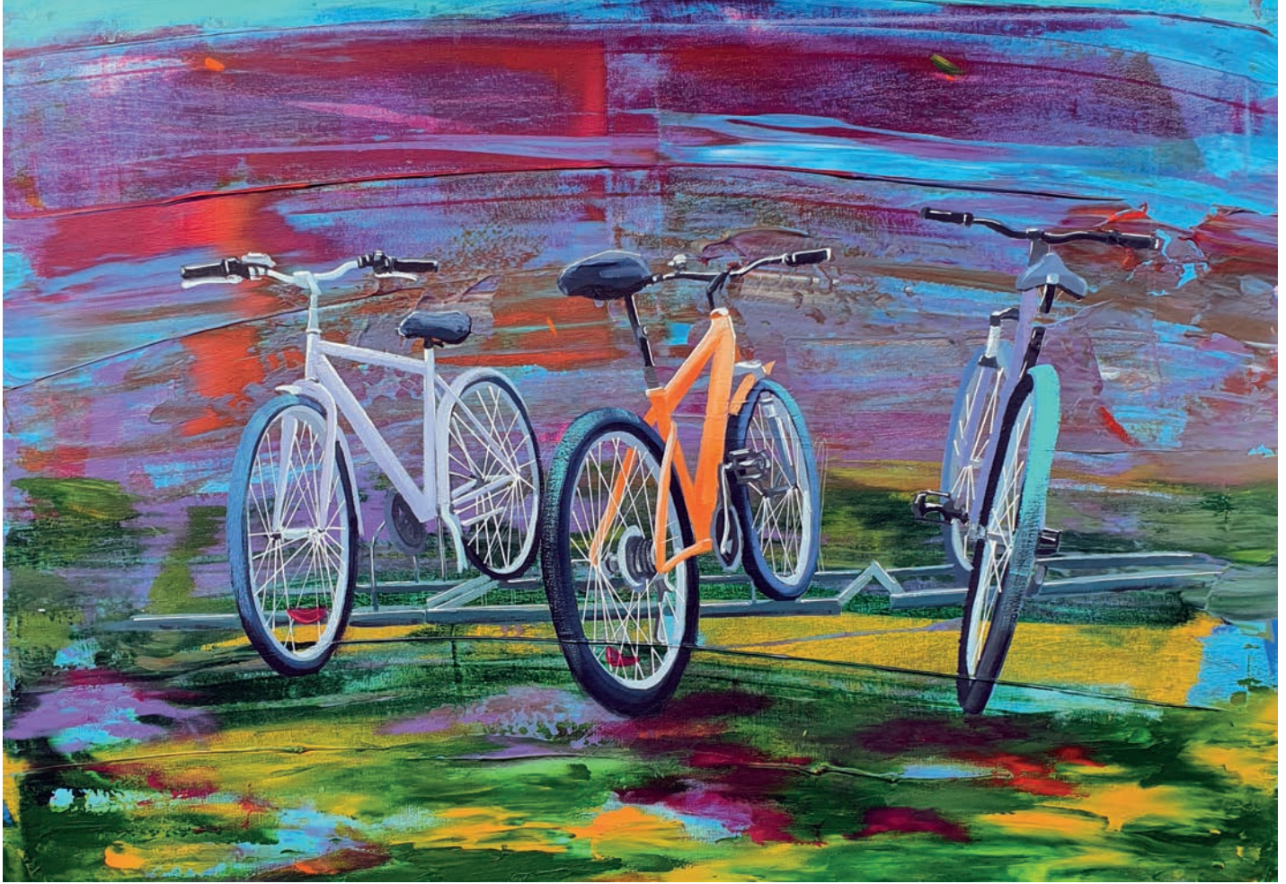
"Peyzaj - IV" 50x70cm, Tuval Üzerine Akrilik, 2022