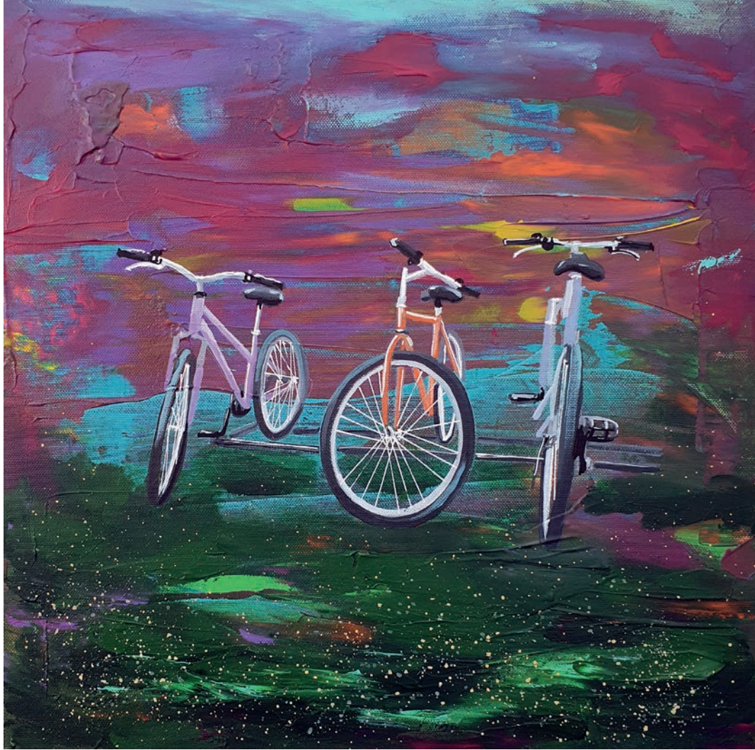
"Bisiklet Serisi" 40x40cm, Tuval Üzerine Akrilik, 2022