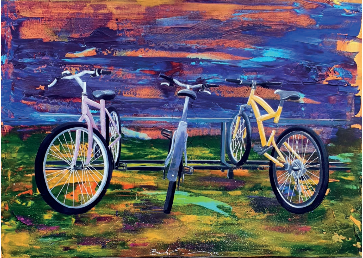
"Peyzaj - VI" 50x70cm, Tuval Üzerine Akrilik, 2022