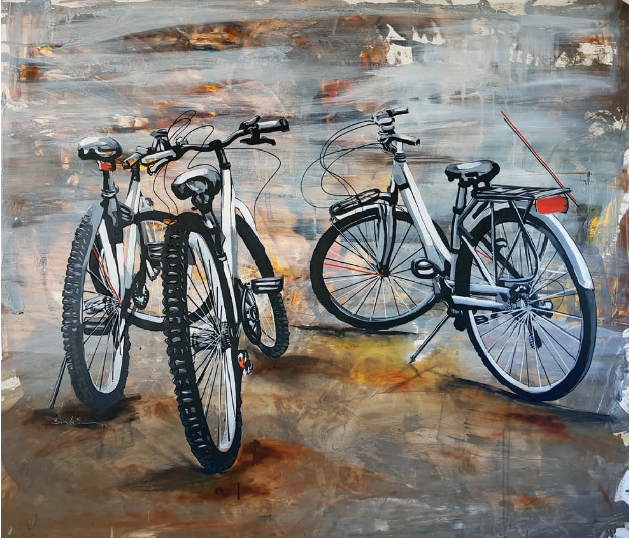
"Üç Bisiklet" 140x120cm, Tuval Üzerine Akrilik, 2018