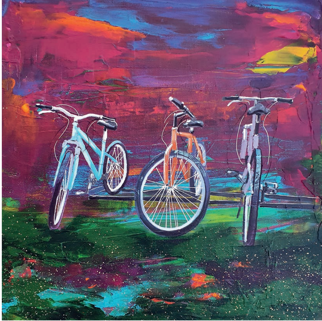
"Bisiklet Serisi" 30x30cm, Tuval Üzerine Akrilik, 2022