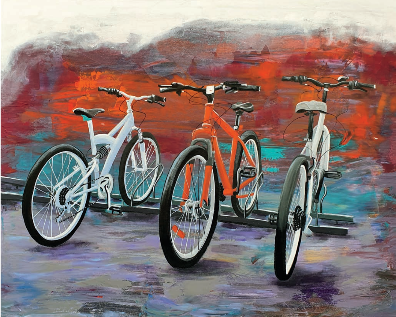
"Sessiz Bekleyişler" 80x100cm, Tuval Üzerine Akrilik, 2020