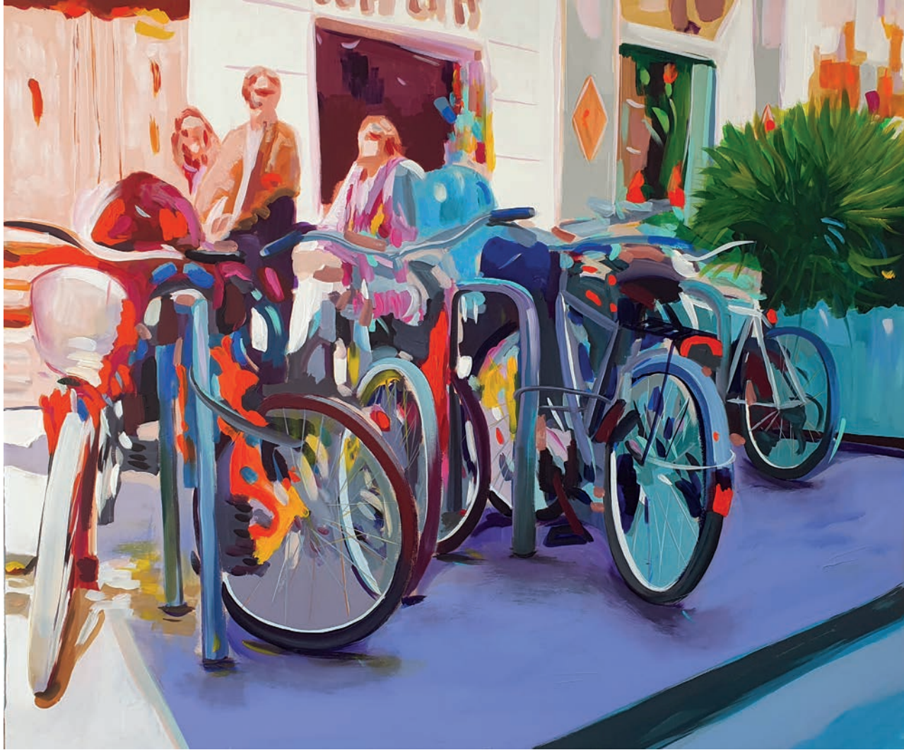
"Hayatlar" 92x110 cm, Tuval Üzerine Akrilik, 2023