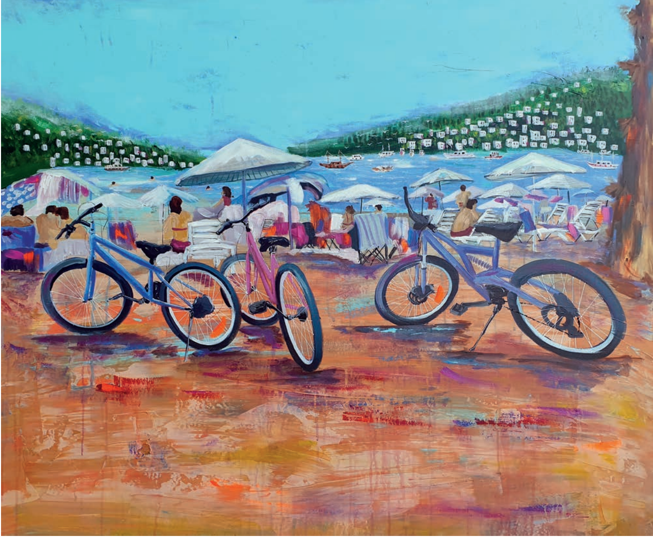
"Plaj" 100x120cm, Tuval Üzerine Akrilik, 2023