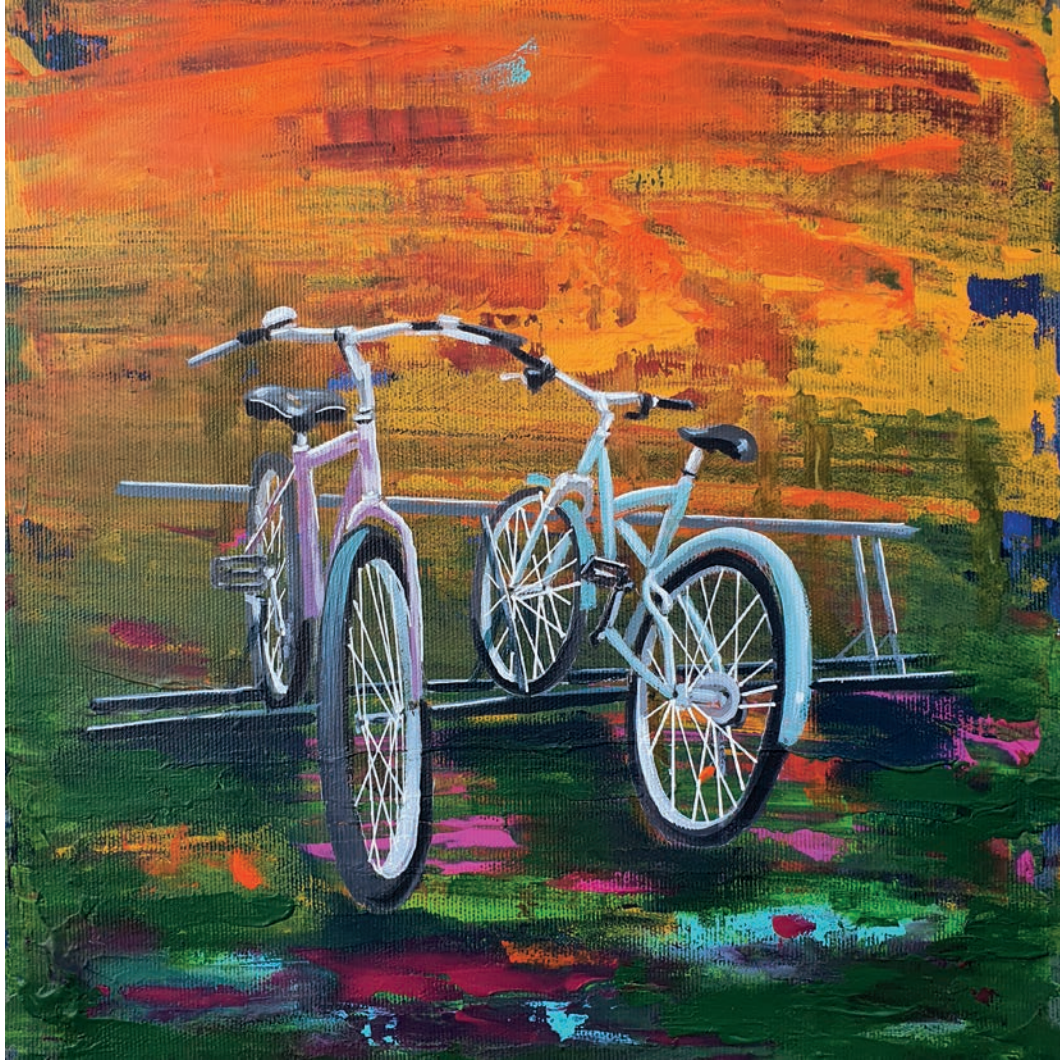
"Sarı" 30x30cm, Tuval Üzerine Akrilik, 2022