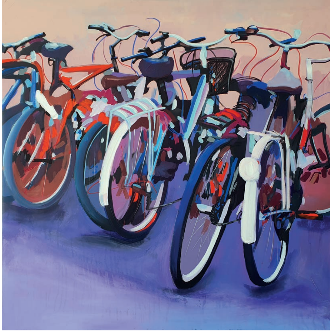
"Bisikletler II" 92x92 cm, Tuval Üzerine Akrilik, 2023