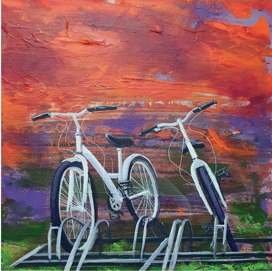
"Bisiklet Gnlkleri" 30x30cm, Tuval zerine Akrilik, 2022