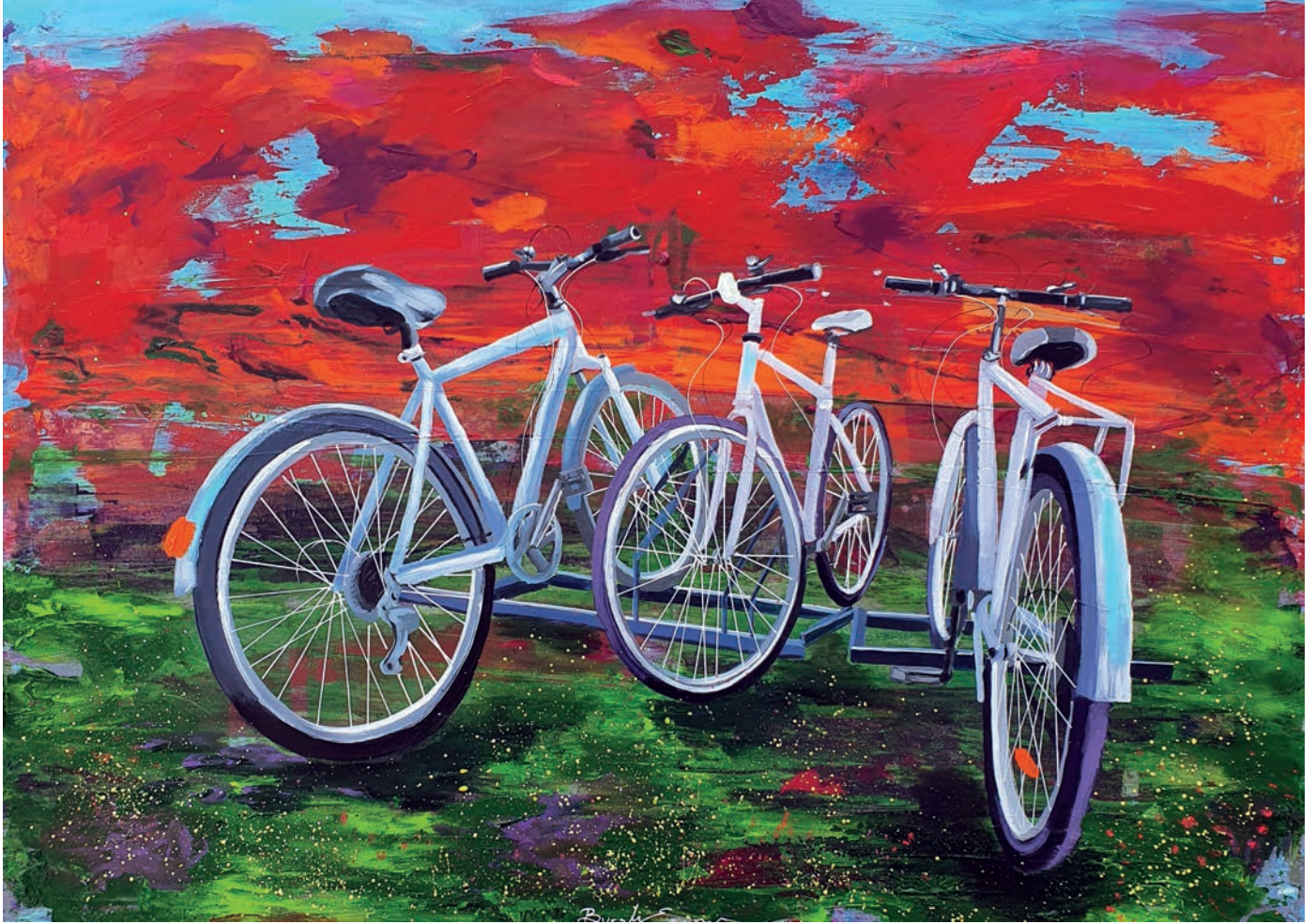
"Peyzaj - II" 50x70cm, Tuval Üzerine Akrilik, 2022