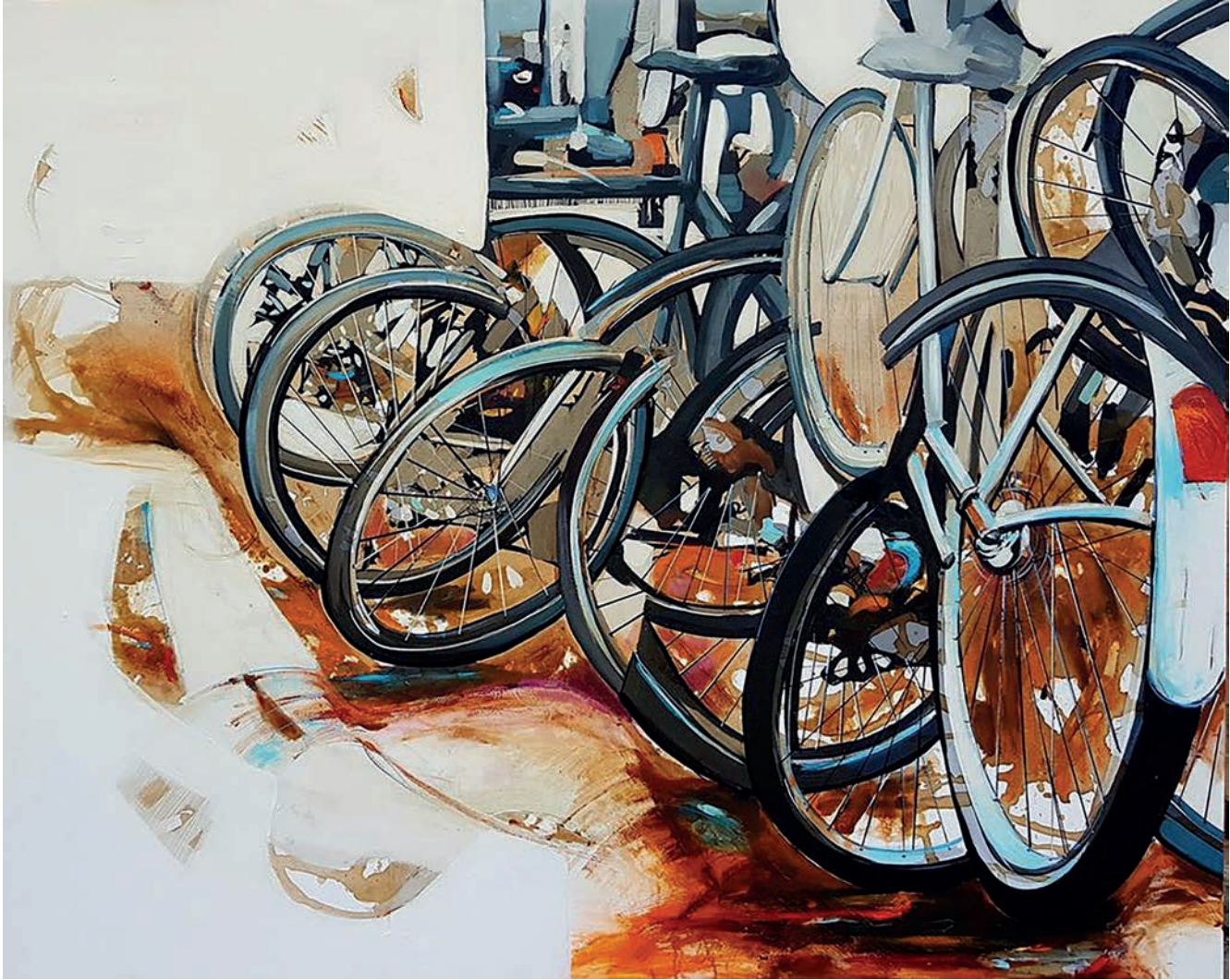
"Beyaz Kompozisyon" 150x120cm, Tuval Üzerine Akrilik, 2017