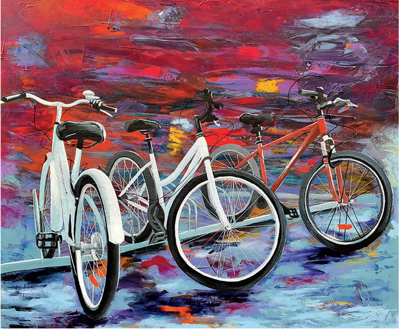
"Park Alanı" 80x100cm, Tuval Üzerine Akrilik, 2020