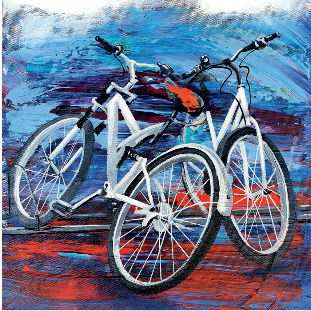
"Beyaz Seri" 30x30cm, Tuval Üzerine Akrilik, 2020