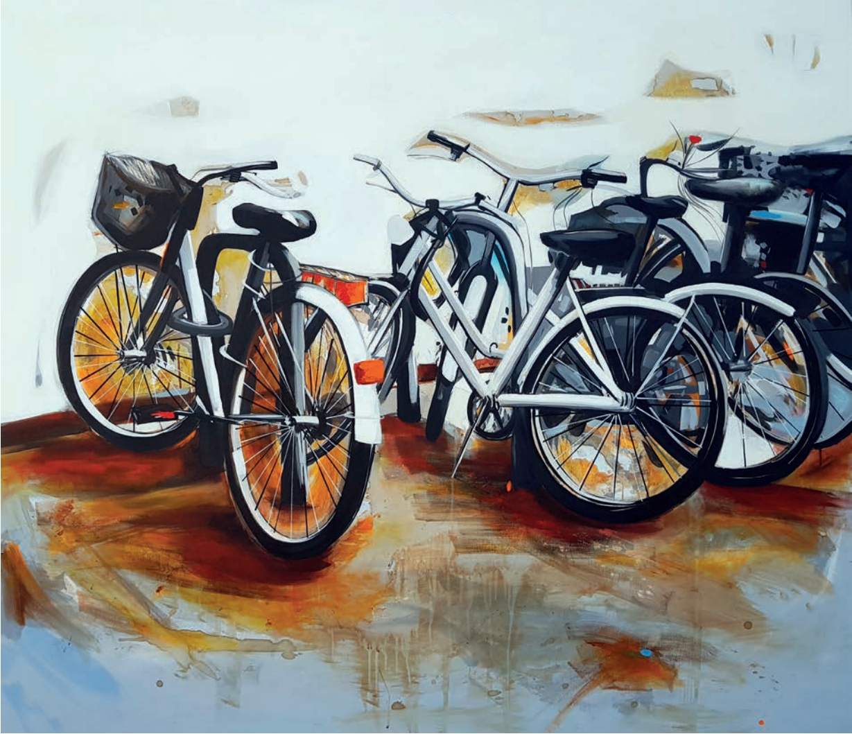
"Beyaz Bisikletler" 150x130cm, Tuval Üzerine Akrilik, 2018