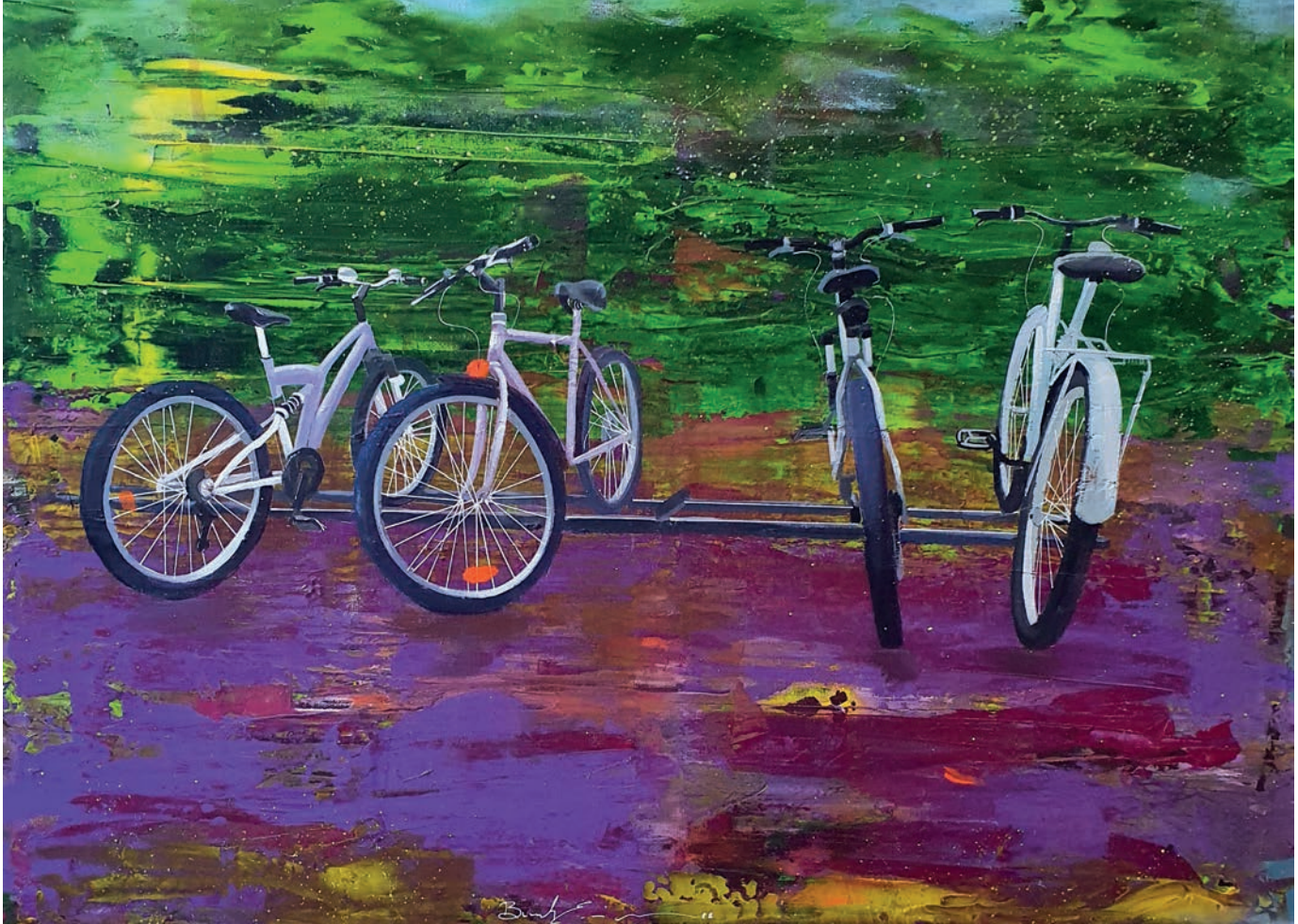
"Peyzaj - I" 50x70cm, Tuval Üzerine Akrilik, 2022