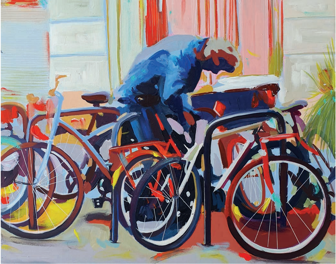
"Denge II" 40x50 cm, Tuval Üzerine Akrilik , 2023