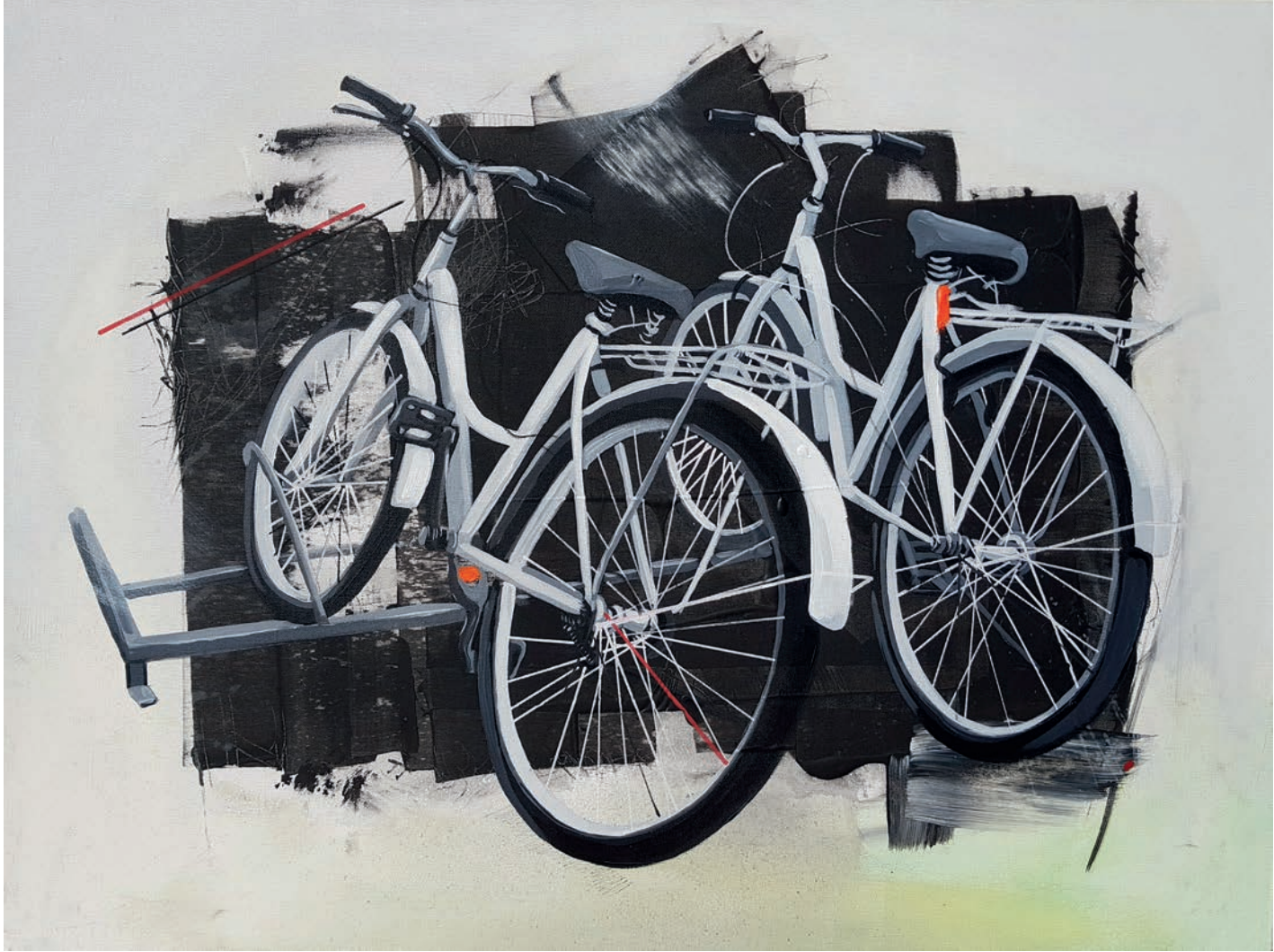
" Biz Bađladık Ya Sen" 60x80cm, Tuval Üzerine Akrilik, 2019