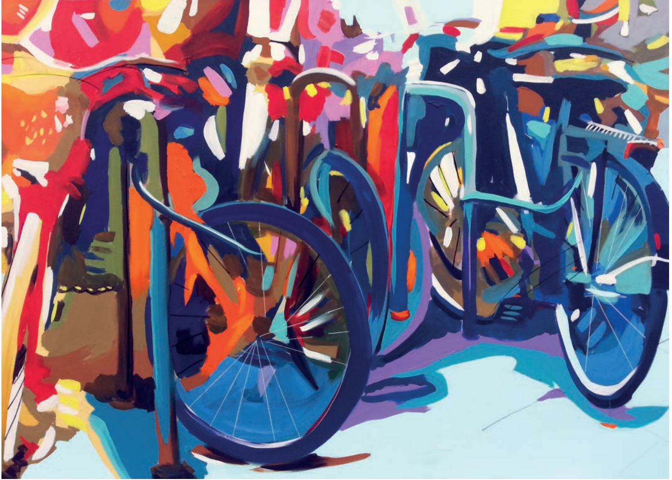
"Bisiklet Parkları" 140x170cm, Tuval Üzerine Akrilik, 2016