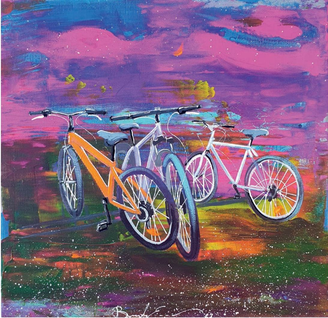
"Bisiklet Günlükleri IV" 30x30cm, Tuval Üzerine Akrilik, 2023