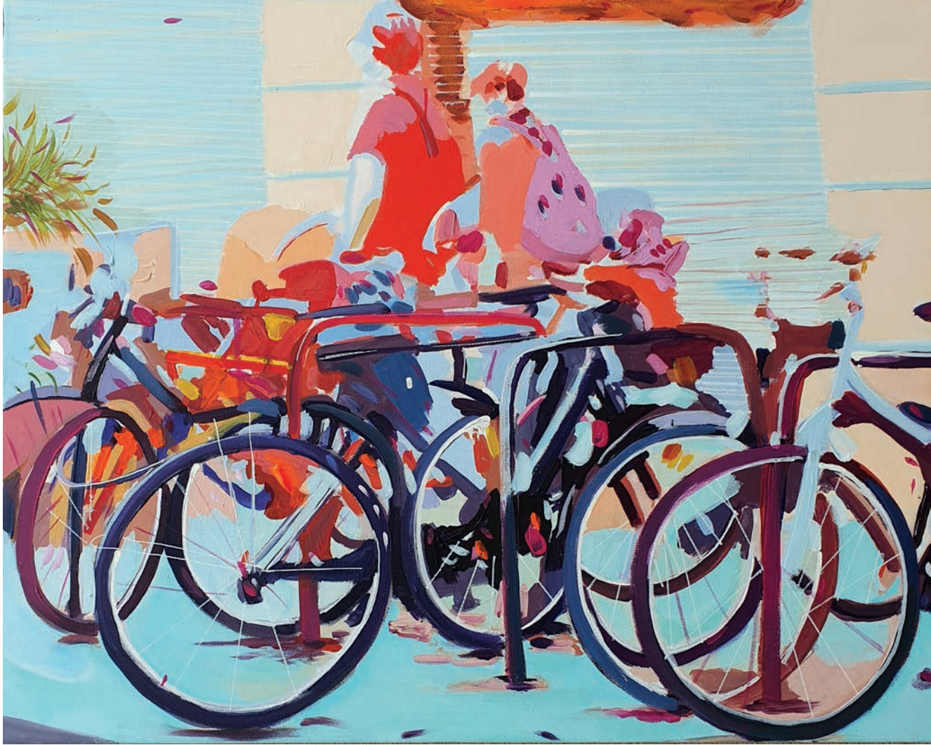
"Denge" 40x50 cm, Tuval Üzerine Akrilik , 2023