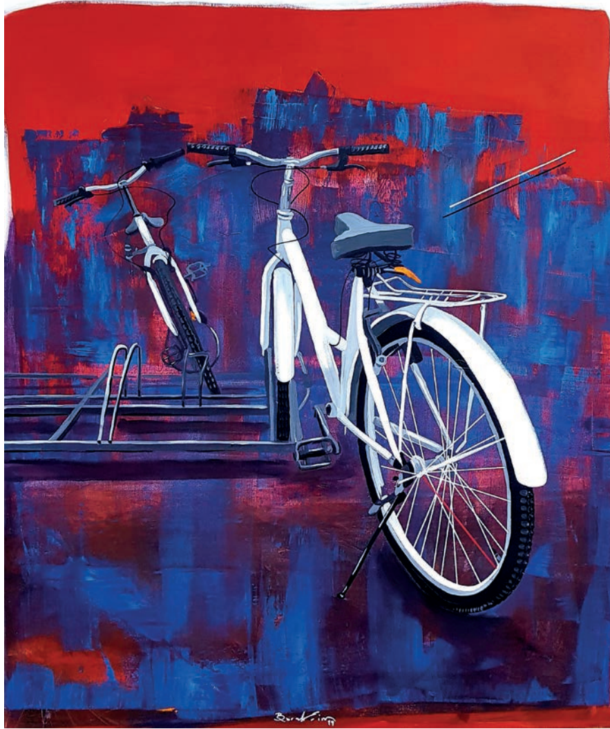
"Karşılıklılar" 100x120 cm, Tuval Üzerine Akrilik, 2019