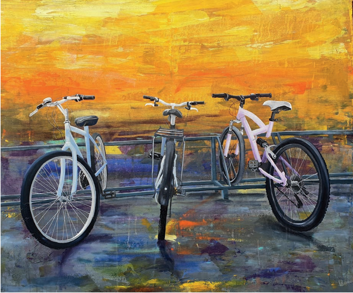
"Sabaha Karşı" 100x120 cm, Tuval Üzerine Akrilik, 2022